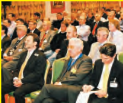
Alle IPAF leden kunnen jaarlijks gratis deelnemen aan de Access Summit.