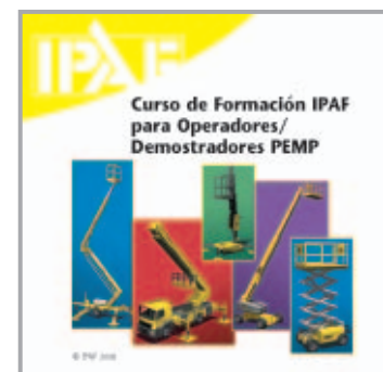
IPAF proporciona amplio material de formación.