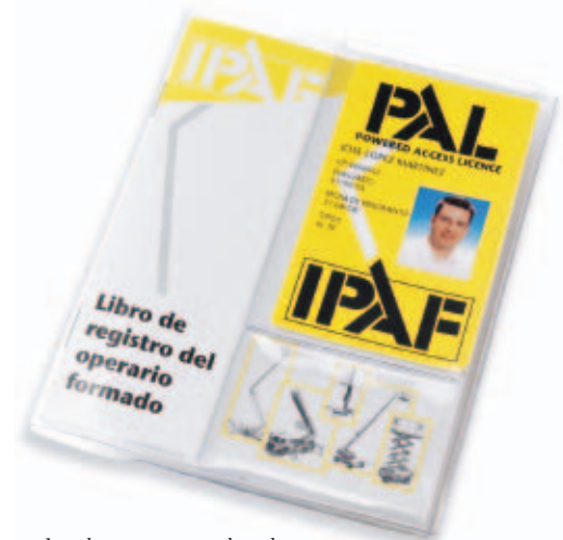
Los alumnos que aprueban el curso recibirán una Tarjeta PAL, un libro de registro y una copia de la Guía de Seguridad para operadores (Que puede ser personalizada con los colores corporativos de tu empresa).