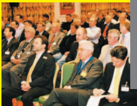
Todos los miembros pueden participar en el congreso anual de IPAF.