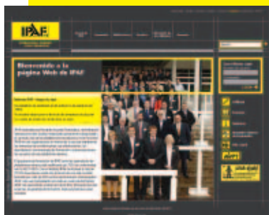
La página Web de IPAF te mantiene al día sobre todos los eventos de la industria del acceso aéreo.

Afiliarte a IPAF aportará a tu negocio información muy valiosa, oportunidades de negocio, importantes posibilidades de crecimiento y desarrollo y el respeto en tu sector.