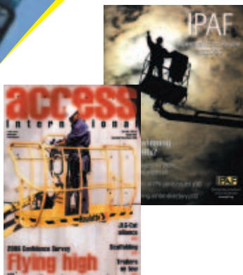
Access International, junto a revista anual de IPAF (IPAF Powered Access Review) es una publicación gratuita para los afiliados de IPAF.