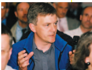
Los eventos de IPAF representan importantes oportunidades de negocio.