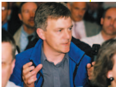
Los eventos de IPAF representan importantes oportunidades de negocio.